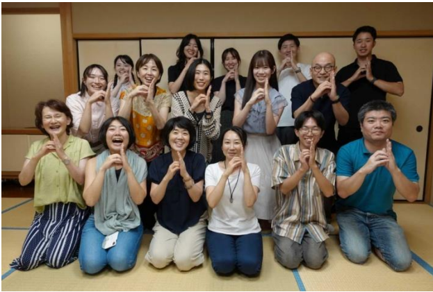
d-lab2025 ボランティア・講師・スタッフ

なお、各事業にかかわった委員会やタスクチームのメンバーについては、15～16頁をご覧ください。