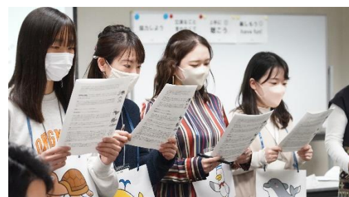
教材体験フェスタは4年ぶりに対面で！