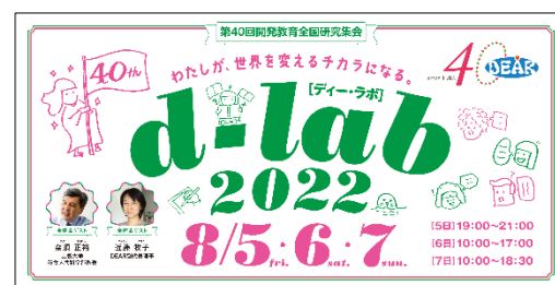
d-lab はオンラインで開催しました