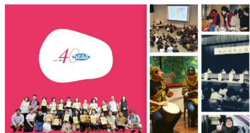
40周年記念フォーラムを開催しました