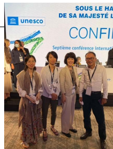
「第7回ユネスコ国際成人教育会議」に参加しました